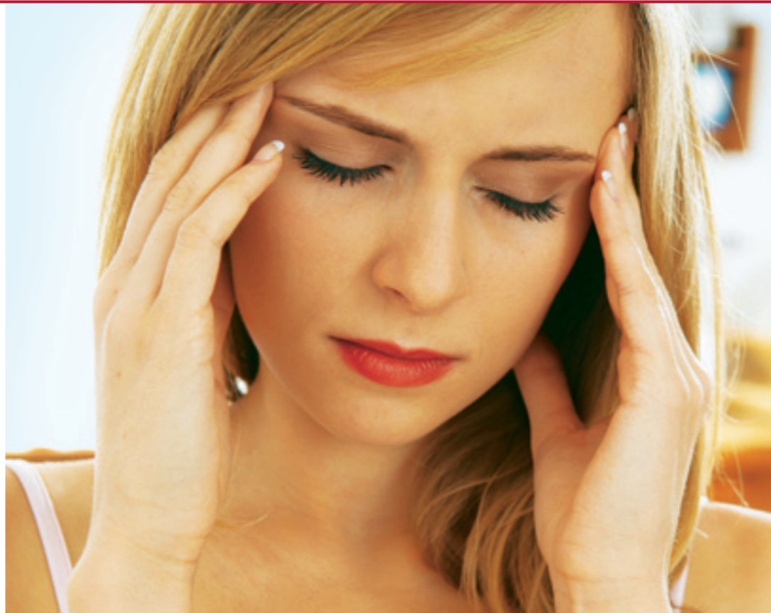
Migräne Früher galten die Kopfschmerzen als unheilbar, doch Experten können helfen